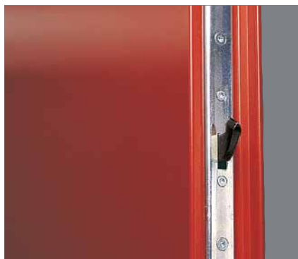
Sikkerhedsdør S43 har en flerpunktlås, hvor hovedlåsen suppleres med låserigler foroven og forned.