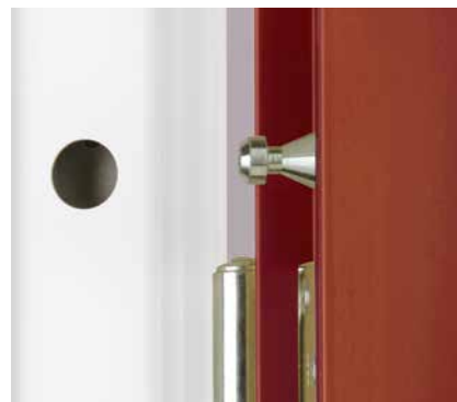
Faste nokker med modhager i bagkanten og hængsler med sikrede splitter for øget sikkerhed.